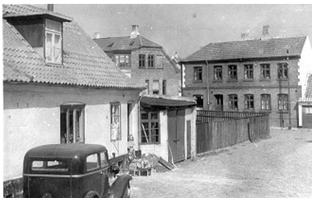
Det var her i denne gård farfar boede og legede som barn.

Farfar er født i 1939, det var lige før krigen startede i Danmark. Så derfor er farfars barndom og de første 7 jule aftner foregået medens der var krig i Danmark. Der var soldater overalt i gaderne og i gården der hvor jeg boede. Det syntes jeg nu ikke altid var så stor en ulempe, for alle danskere var så glade og flinke over for hinanden. Det var kun tyskerne man ikke kunne lide, det var jo dem vi var i krig med. Men tyskerne var nu meget flinke over for os børn.